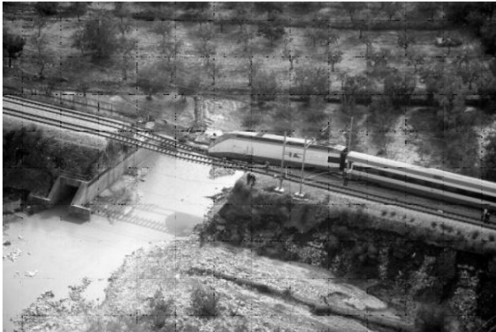
Figura 2 – Il rilevato ferroviario danneggiato dall'alluvione

Il bacino della lama Baronale-Picone che si estende dalle aree della Murgia di Cassano sino alla costa in corrispondenza della città di Bari è stato oggetto del nostro studio, in considerazione dei recenti eccezionali eventi meteorici (il 23 ottobre 2005 sono stati registrati nella zona di Cassano delle Murge circa 160mm di pioggia in tre) che hanno determinato lungo tutto il bacino della Lama fenomeni di esondazione con conseguenze anche drammatiche (Figura 2).